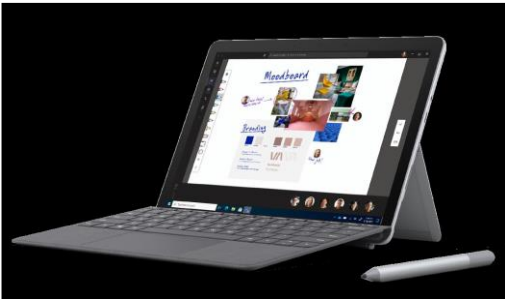
日本マイクロソフト社SurfaceGo10.5インチ タブレットPC GIGAスクールモデル

「日本マイクロソフト社製文教向けタブレット端末」と「多くの導入実績を持つ内田洋行」が、 保守・運用、コンテンツと、活用に繋げる必要最低限のものを組み合わせた 「 GIGAスクール構想に向けた応用パッケージ 」です。